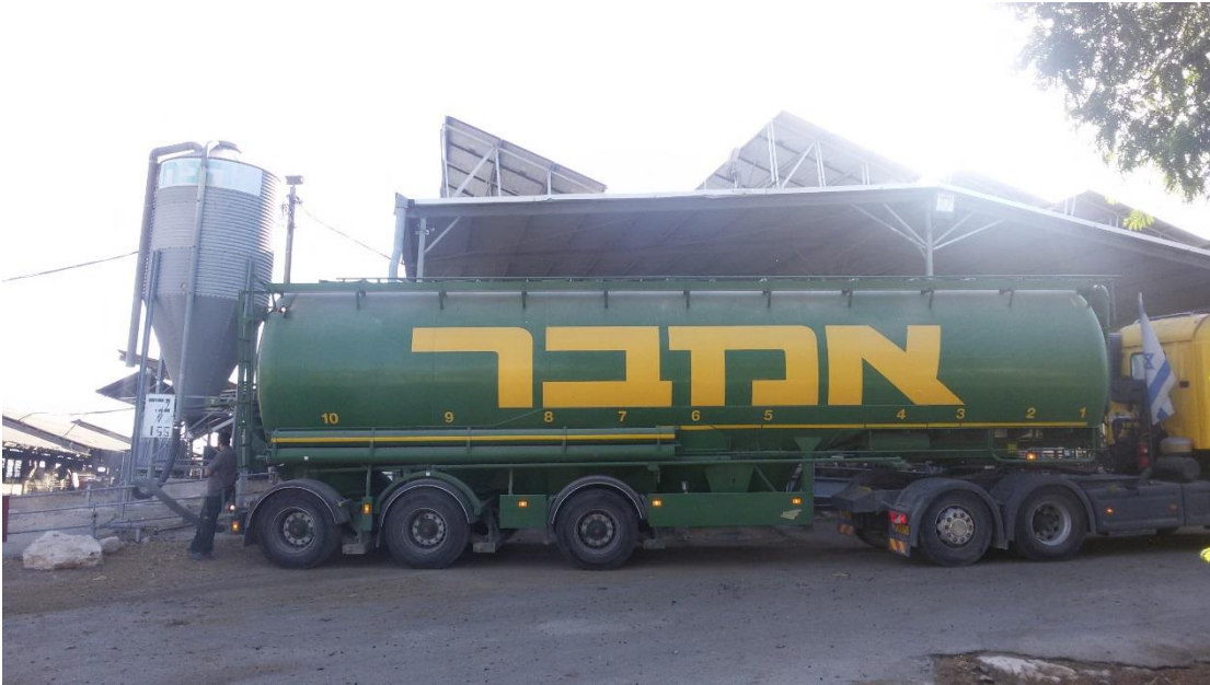
את הגרעינים והכופתיות מקבלים מאמבר ושבעים רצון מאוד